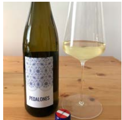
PEDALONES Riesling Ried Obere Schos