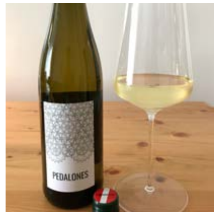
Sauvignon Blanc Ried Obere Schos